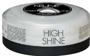
CARE LINE MAN УСИЛЕНИЕ БЛЕСКА Глянцевая паста придает невероятный блеск. HF: 8