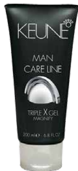
CARE LINE MAN ТРОЙНОЕ ДЕЙСТВИЕ Ультрасильный гель с эффектом «стальной хватки». HF: 20