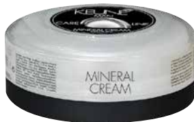
CARE LINE MAN МИНЕРАЛЬНЫЙ КРЕМ Универсальный крем для подчеркивания текстуры прически и придания блеска волосам. HF: 10