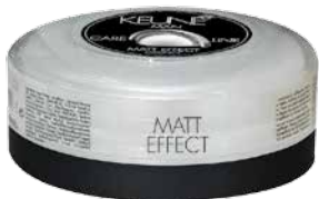
CARE LINE MAN МАТИРУЮЩИЙ ЭФФЕКТ Уникальная укладочная глина на основе пчелиного воска. HF: 16